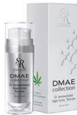
סרום עם אפקט מתיחה מידי SR, 318 שקלים