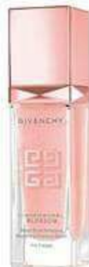
סרום למראה זוהר, ז'יבנשי, 419 שקלים